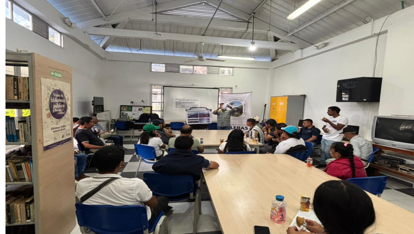
Imagen 1: 05_2026: Talleres conjuntos SFFG y OVSPA